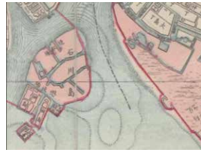
右側海岸の突起部分が越中島 砲台＝明治11年東京全図から