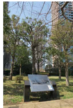
造船所の掲示がある 石川島公園