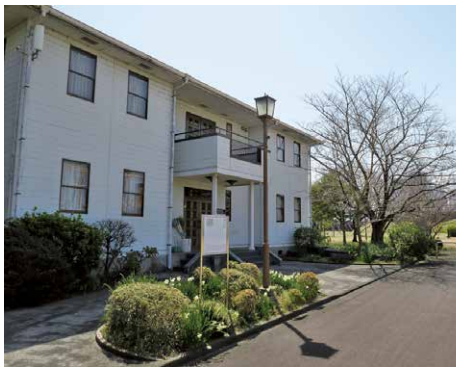
越中島砲台があった 東京海洋大学の職員会館

周辺にあったと推定されており、構内には当時の構築材とみられる石垣石が多く残されています。