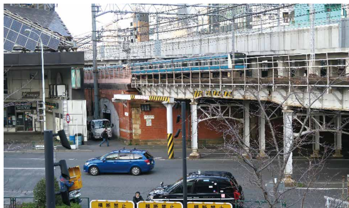
外堀通り面した日本橋の住居付近

いは、現在の中央区日本橋本石町で、日本銀行に近い外堀通りに面した所です。JRのガード下付近にあたるとみられ、他の住居地と同様に残念ながら当時を知る面影は残っておりません。